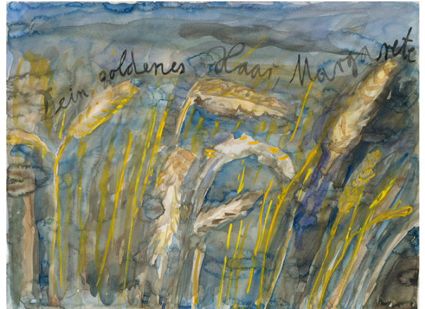
Anselm Kiefer - Goldhair

Langzaam wordt mij duidelijk dat in mijn nieuwe naaste omgeving een onderstroom aanwezig is van onuitgesprokenheid. En op een dag onderweg van Nederland naar Duitsland bedacht ik hoe mooi het zou zijn met Duitse mensen in gesprek te gaan over het tot-nu-toe onuitgesprokene. Ik ben daarom op stap gegaan met de vraag, welke invloed de Duitse geschiedenis heeft op het dagelijks leven. Op mijn eerste vraag naar bereidheid hierover in gesprek te gaan, kreeg ik positieve reacties. Sommigen van mijn Duitse gesprekspartners reageerden geëmotioneerd omdat dit een latente behoefte aan dialoog blijkt te raken en anderen zijn verrast dat een Holländerin daar belangstelling voor heeft. Deze eerste reacties hebben mij moed gegeven om dialooggesprekken te gaan organiseren.