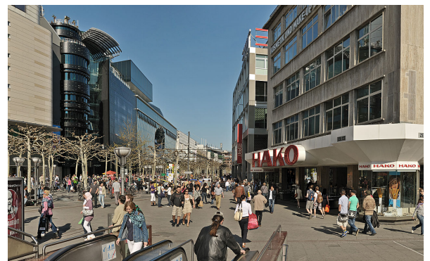
Zo is Frankfurt am Main nu