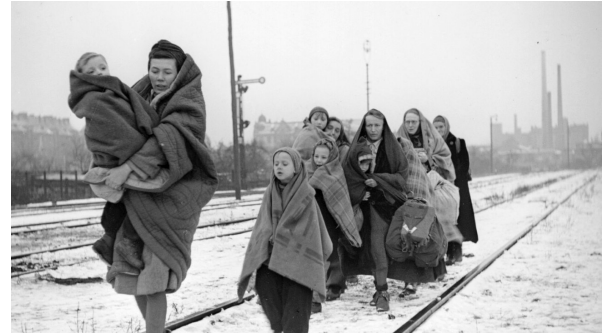
Duitse vluchtelingen aan het einde van de Tweede Wereldoorlog

Het meest in het oog springen de verhalen over ouders en grootouders die verdreven zijn uit de oostelijke delen van Duitsland aan het einde van de oorlog. Deze ingrijpende gebeurtenis heeft destijds bijna iedere familie in Duitsland op een of andere manier geraakt. Mensen die van het ene op het andere moment alles wat ze hadden moesten achterlaten, overwinnaars die zich gerechtigd voelden vrouwen en meisjes te verkrachten en gezinnen die lange tijd geen plek konden vinden om daarmee een veilig thuis te creëren voor hun kinderen.