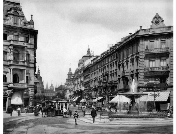
Zo was Frankfurt am Main voor de oorlog

In Duitsland moet je echt naar zoeken naar mooie stadskernen, want de meeste oude binnensteden zijn in de vorige eeuw systematisch platgebombardeerd en razendsnel goedkoop en fantasieloos herbouwd. Ik woon nu anderhalf jaar in Frankfurt am Main en heb echt door de gevels heen moeten leren kijken. Achter een liefdeloze gevel kan namelijk best een mooie winkel of gezellig café schuilgaan.