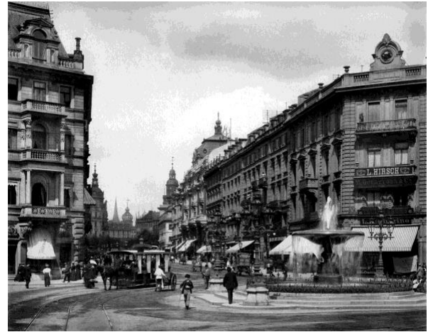
So war Frankfurt vor dem Krieg

In Deutschland aber ist das Szenario der stilvollen Altstadt kern leider meistens verschwunden, denn fast alle Zentren großer Städte wurden im letzten Jahrhundert systematisch bombardiert und billig phantasielos in rasanter Geschwindigkeit wiederaufgebaut. Ich lebe seit anderthalb Jahren in Frankfurt am Main und musste wirklich lernen, durch die Fassaden hindurch zu sehen. Hinter einer lieblosen Fassade verbirgt sich manchmal ein schöner Laden oder ein gemütliches Café.