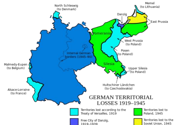
Deutsche Gebietsverluste nach den Weltkriegen

Allerdings ist es auch in Deutschland nicht einfach, die Täter- Opfer Dynamik zu sehen und zu verstehen. Es ist das Leiden des 'Tätervolkes', das nicht einfach zugänglich ist. Die erste Generation spricht wahrscheinlich aus Scham- oder Schuldgefühlen nicht darüber, oder um diese schreckliche Zeit (und Emotionen) hinter sich zu lassen und voranzuschreiten. Die zweite Generation wagt es nicht, weiter zu fragen, nachdem sie mit