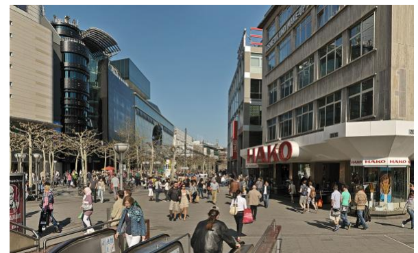
Wie Frankfurt am Main wurde