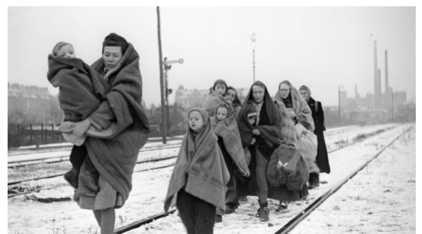
Deutsche Flüchtlinge am Ende des Zweiten Weltkriegs

Am auffälligsten sind die Geschichten von Eltern und Großeltern, die nach Kriegsende aus den östlichen Teilen Deutschlands vertrieben wurden. Dieses dramatische Ereignis betraf fast jede Familie in Deutschland auf die eine oder andere Weise. Menschen, die von einem Moment auf den anderen alles zurücklassen mussten, und sich mit Siegermächten auseinandersetzen mussten, die sich berechtigt fühlten, Frauen und Mädchen zu